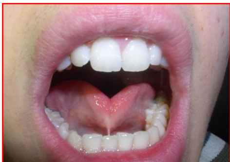
Короткая подъязычная связка

Короткая подъязычная связка (уздечка) — врожденный дефект, заключающийся в укорочении уздечки языка (подъязычной связки).